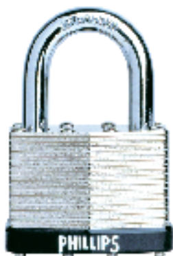
LAM - 50