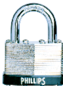
LAM - 40