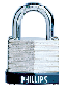
LAM - 30