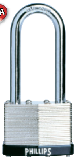
LAM - 50 GL